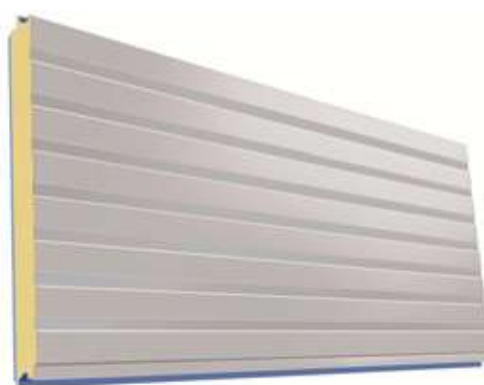
FB – Face Interna

Os novos painéis termoisolantes para fachadas da série Termilor Wall® - TW são fabricados com a chapa externa micronervurada, a interna nervurada e 40, 50 ou 70 mm de poliisocianurato (PIR).