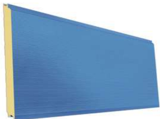
FA – Face Externa